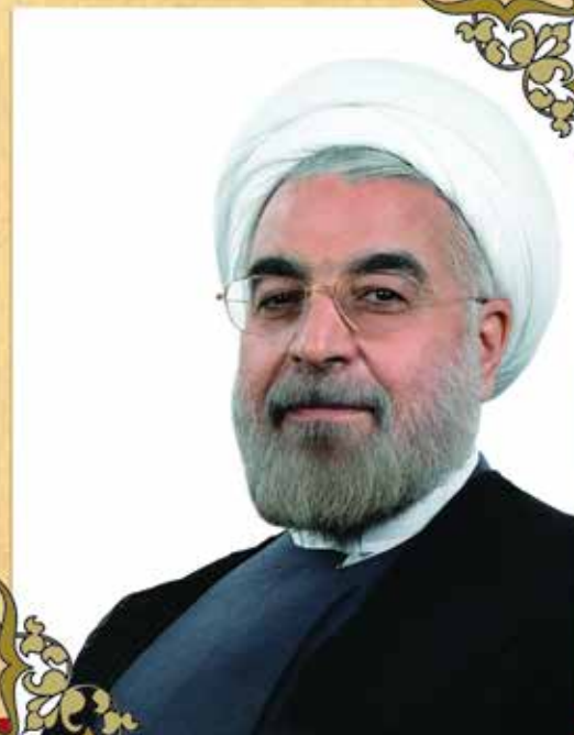
ریاست محترم جمهوری جناب آقای دکتر حسن روحانی

فرهنگ‌سازی و ترویج روحیه خستگی‌ناپذیری و مبارزه‌طلبی بی‌وقفه موتور محرک اقتصاد دانش‌بنیان است.