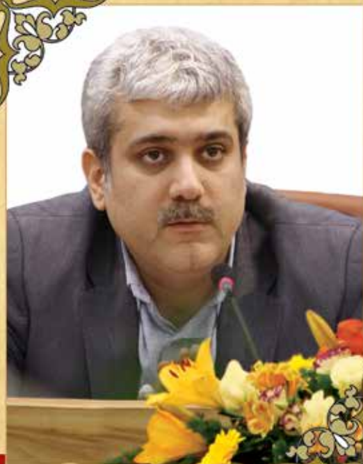
معاون علمی و فناوری ریاست محترم جمهوری جناب آقای دکتر سورنا ستاری

فرهنگ‌سازی و ترویج روحیه خستگی‌ناپذیری و مبارزه‌طلبی بی‌وقفه موتور محرک اقتصاد دانش‌بنیان است.